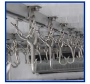
Sistema canalero corredizo