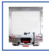
Puerta Trasera de Cortina